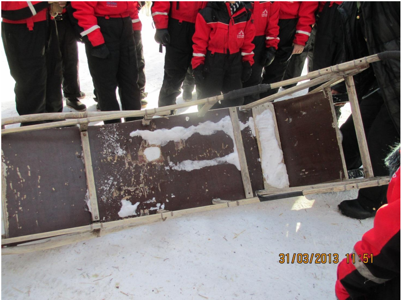
Rovaniemi. Particolare della slitta trainata dai cani durante la spiegazione di come si guida da parte dei nostri esperti accompagnatori lapponi. (gli accompagnatori seguiranno la nostra scorribanda in slitta trainata dai cani con velocissime motoslitte)