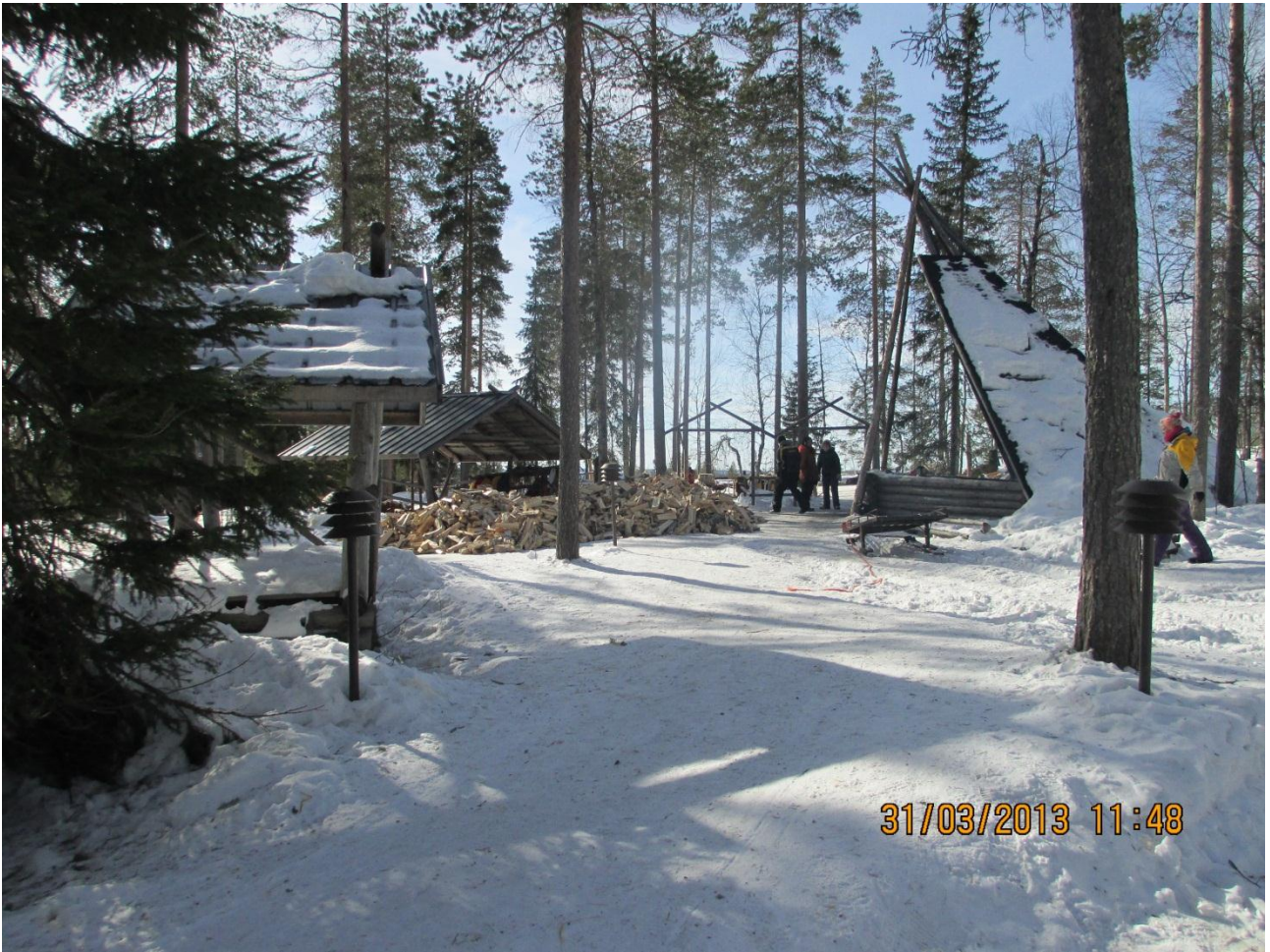
Rovaniemi. Veduta del ranch dove troveremo i cani da slitta.