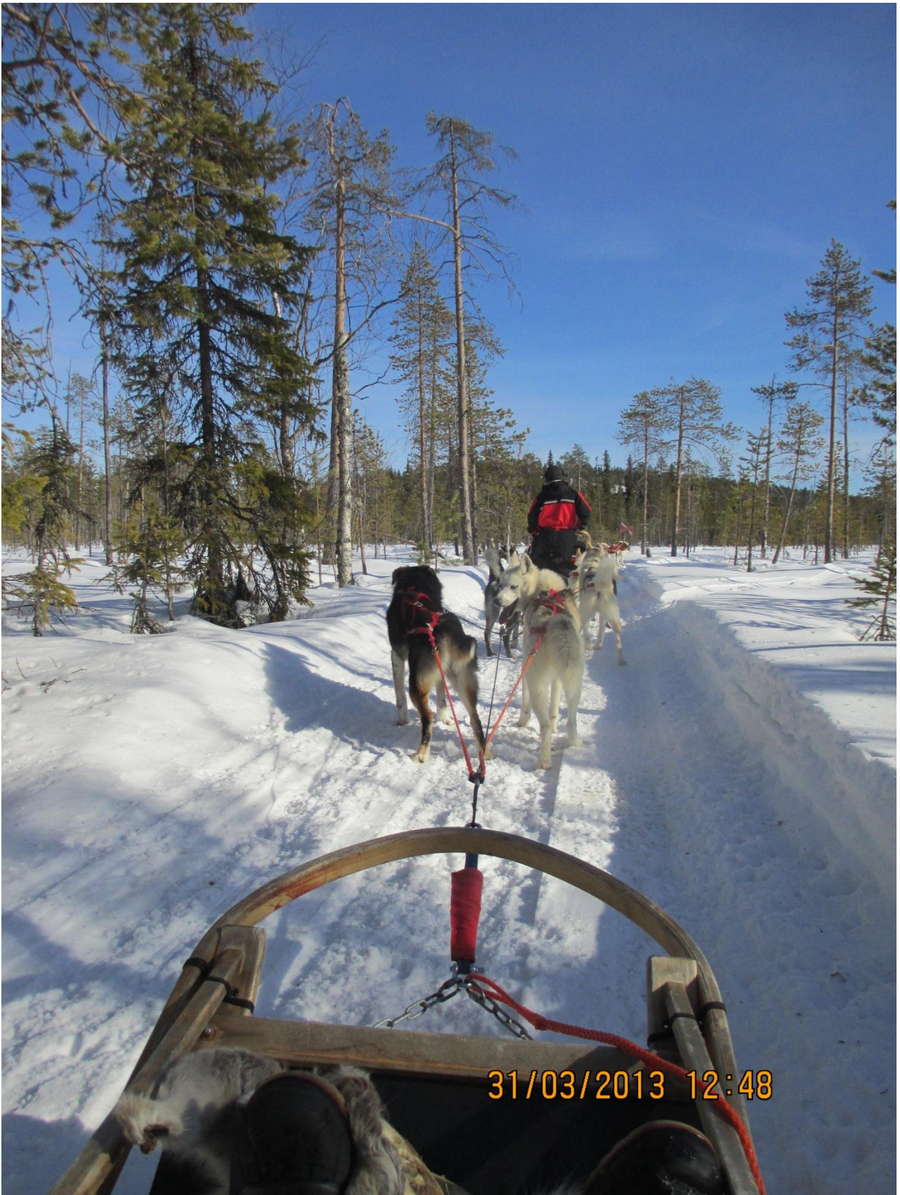
Rovaniemi. La carovana di slitte in viaggio.