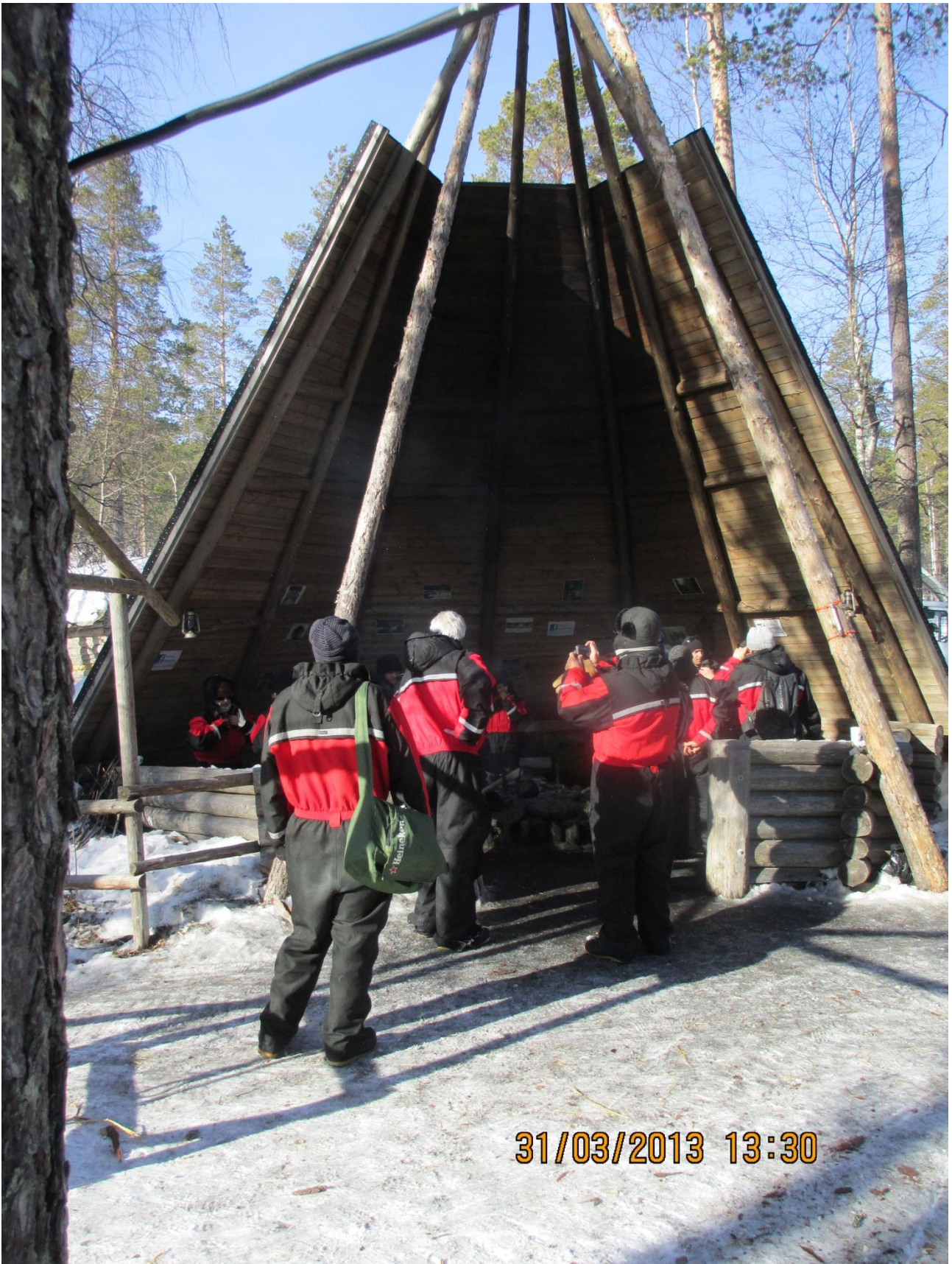
Rovaniemi. Dopo la gita in slitta con i cani .... Ristoro con tè e pasticcini in questa che credo tipica capanna lappone.