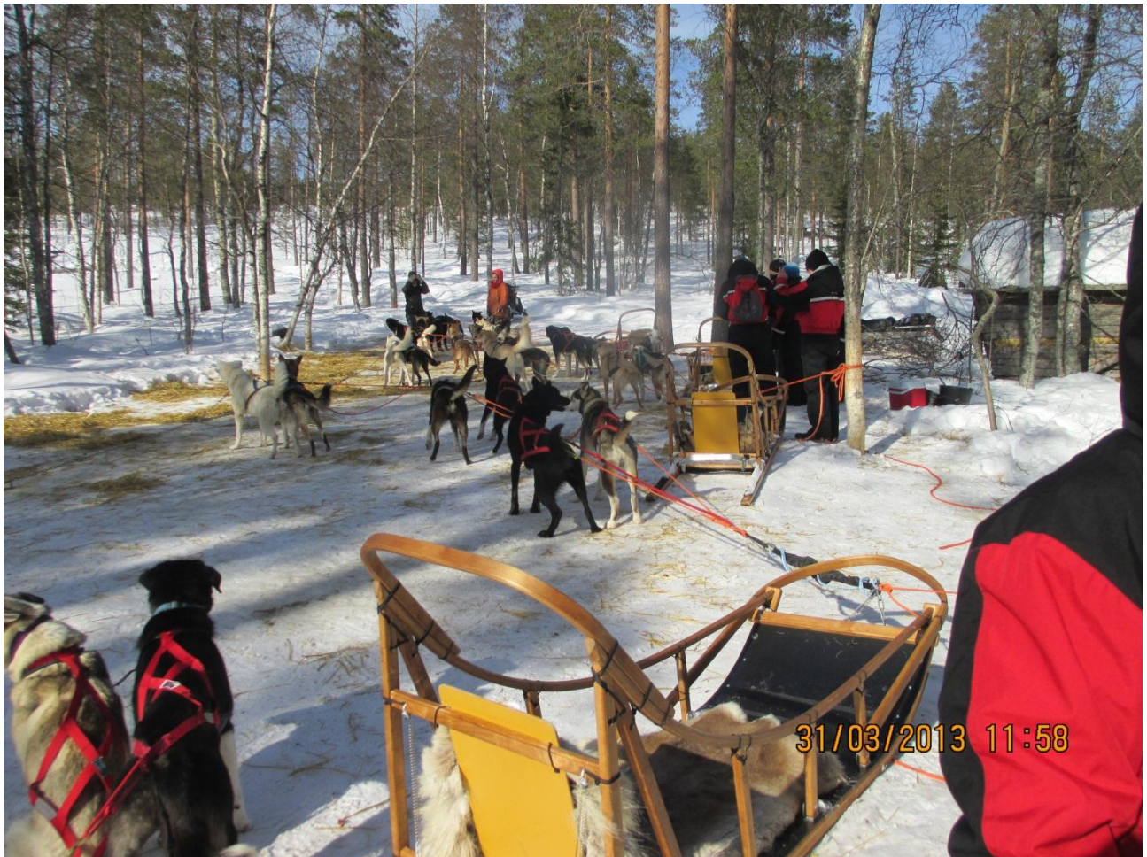
Rovaniemi. Le mute di cani sono impazienti di partire per la scorribanda in slitta.