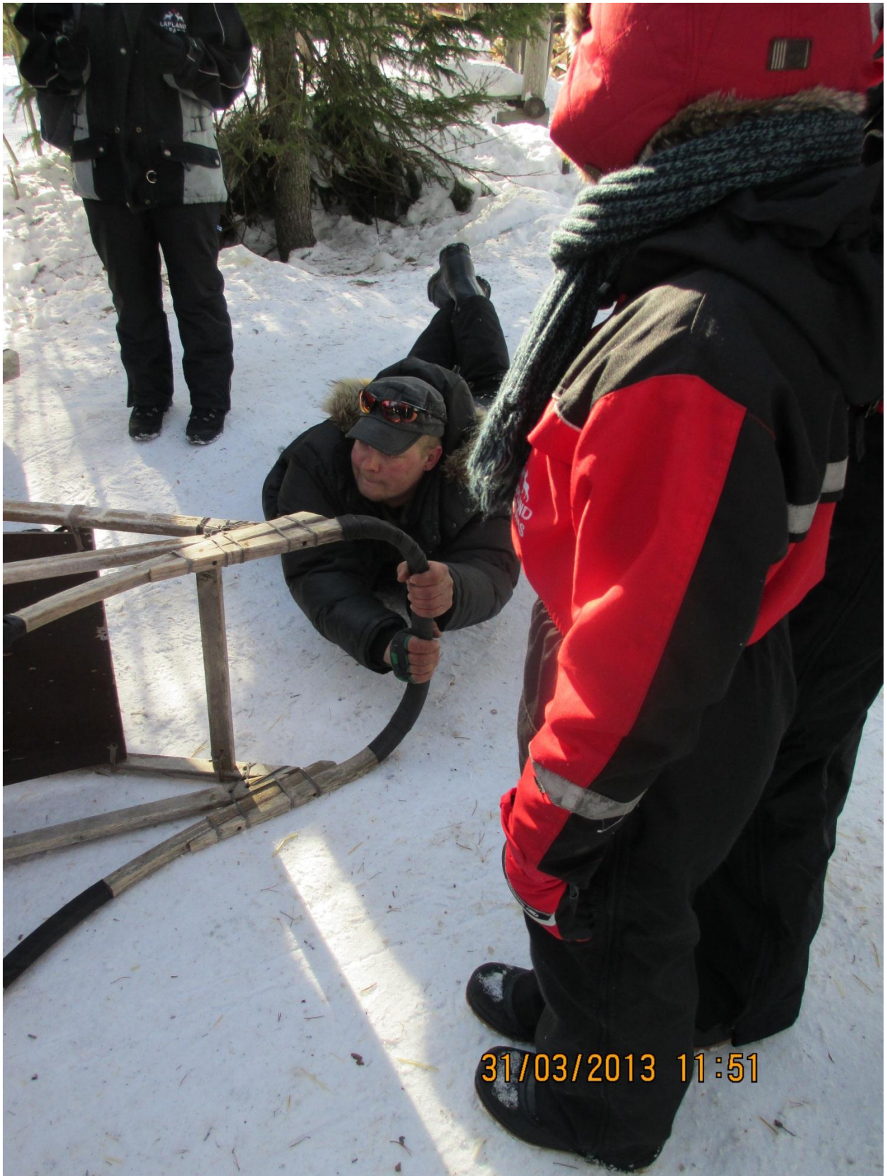
Rovaniemi. Ancora istruzioni pratiche di come si guida la slitta trainata dai cani. Dimostrazione pratica di come ci si debba tenere assolutamente appesi anche nel malaugurato caso di caduta.